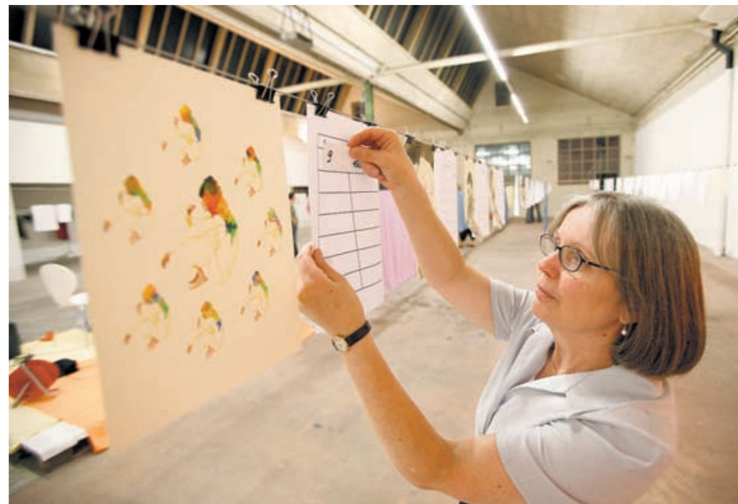
Reihenweise Kunst: Eine Besucherin hängt ihre Zeichnung auf (oben rechts der Beitrag der «Montag»-Redaktion).